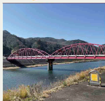
テーマ② 江の川の橋