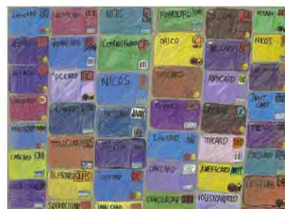
「無題」 坂口 真一郎