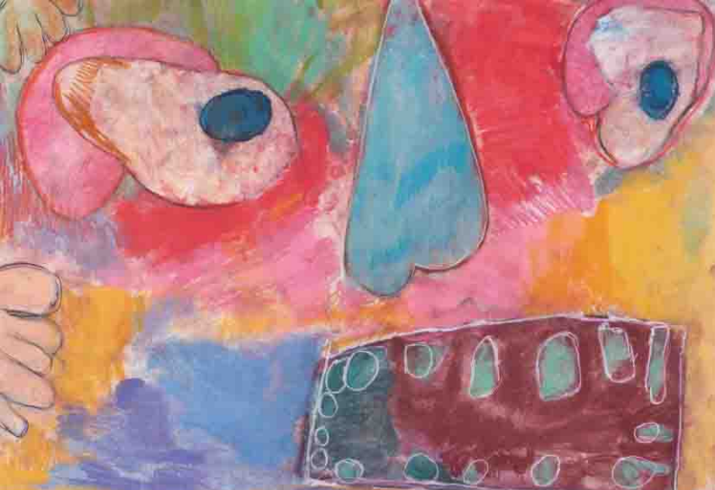
「自画像」 永戸 輝明 | 2024年度 銀賞