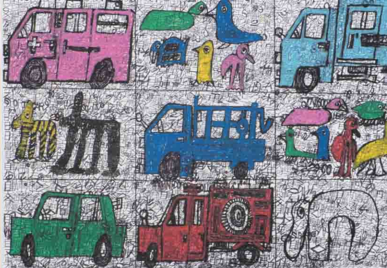
「かくれんぼ」 舟木 伸夫 | 2024年度 銀賞