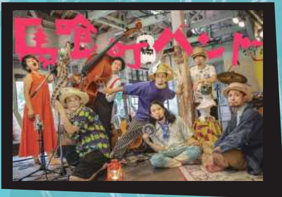
イラスト: 武徹太郎 / 馬喰町バンドロゴ: 平野甲賀

日本のわらべうたや民謡から世界の音楽まで ぐるぐるミックス! ココロもカラダも踊る馬喰町バンドの ライブ開催! 子どももおとなも、障がいがある人もない人も 一緒に楽しめるライブやロビーでのアート体験やミニマルシェなど、 にぎやかで色とりどりの表現をお楽しみください。