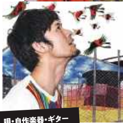
唄・自作楽器・ギター