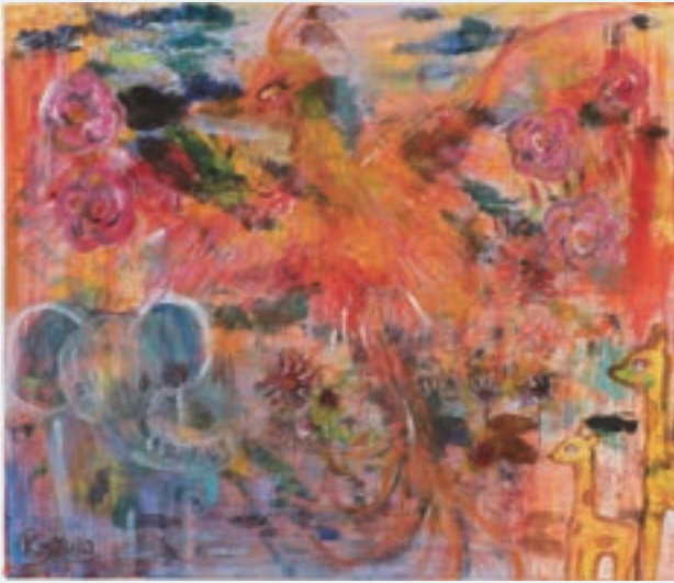
「Breath Back」 柏原 佑佳 | 2022 年度 銀賞