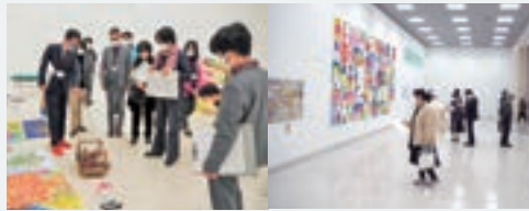
2022 年度公開審査会と展示会の様子

芸術・文化活動を通じた 障がい者の自立と社会参加を推進し、 県民の障がい者に対する 理解と認識を深めることを 目的として開催します。 展示される作品は 応募のあった島根県内の 障がいのある人が創作した作品を 審査した上で展示します。