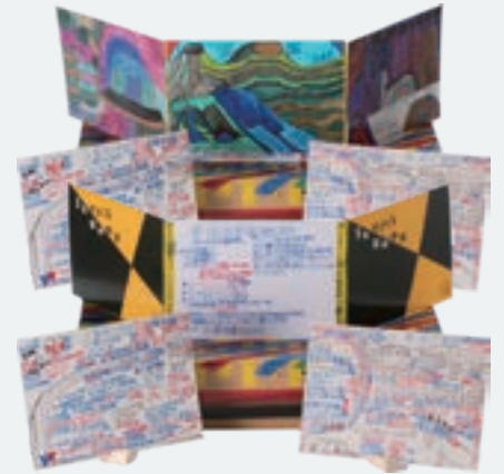
「山陰地方の要部での四季折々の風景」 清水 修二 | 2022 年度 銅賞