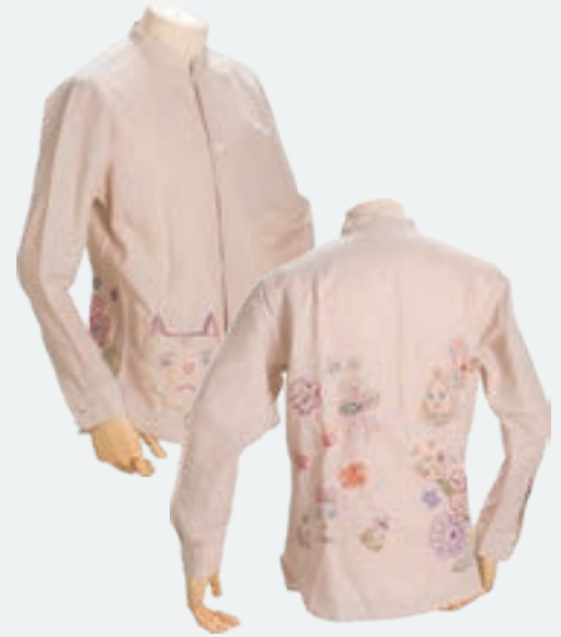
「ねこと花の森」 横田 佳代子 | 2022 年度 銅賞