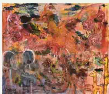
【銀賞】『Breathe back』 柏原 佑佳