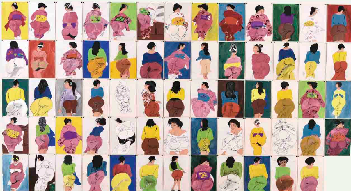
【金賞】『お尻コレクション』 清水 信博