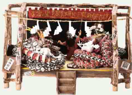
【銀賞】『昭和の大蛇』 ファンキーミウラ