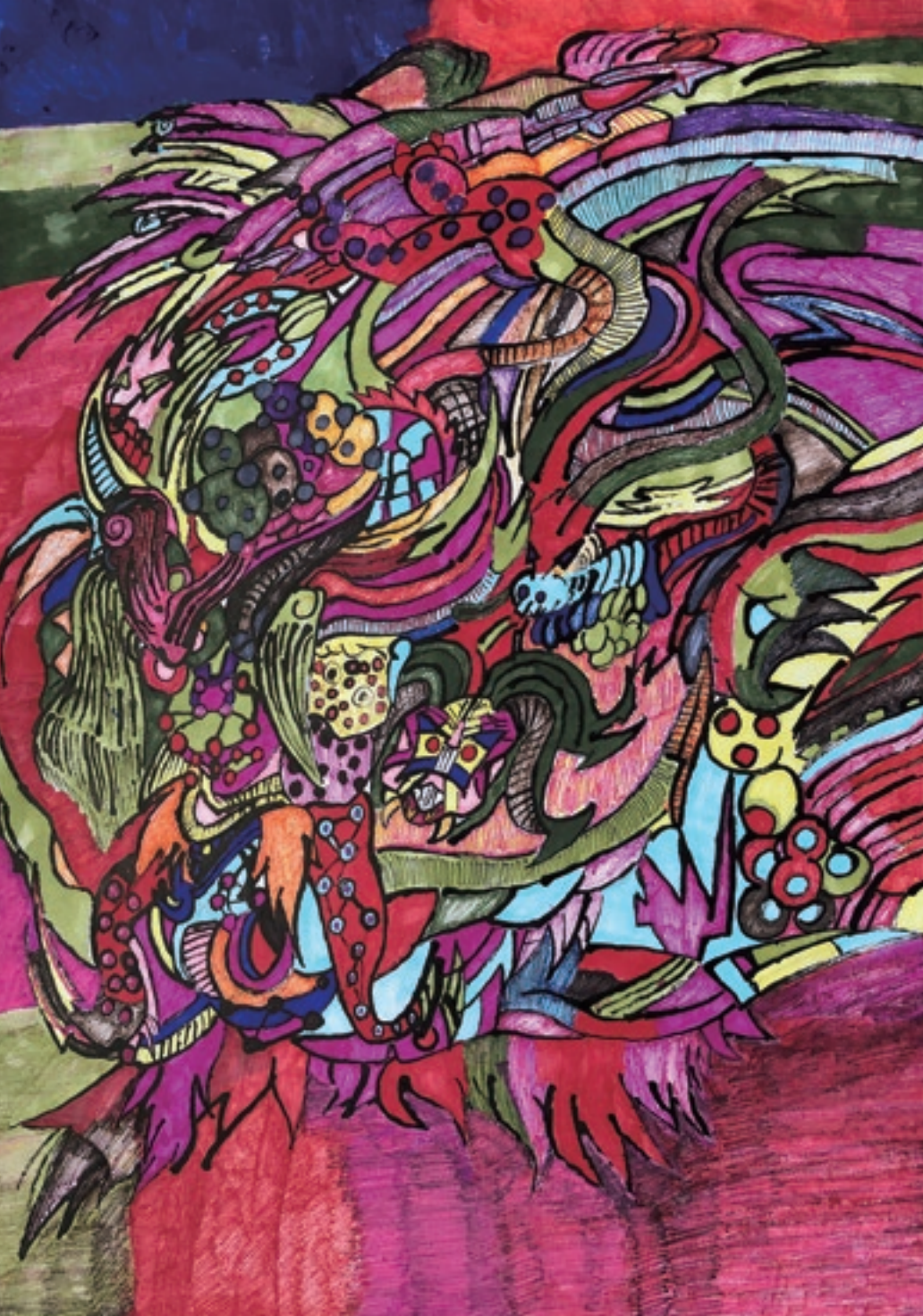
【最優秀賞】空想画 八百万の神々 / 鹿島大佑

※Web作品展は、スマホからは下記のQRコードからアクセスできます。 PCからは、アートベースしまねいろの公式ホームページからご覧いただけます。