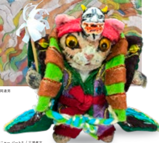
【最優秀賞】 般ニャーパートII / 三浦孝文