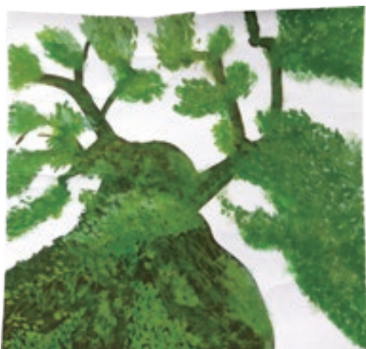
【最優秀賞】 大木 / 山本千裕