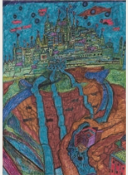
【銀賞】『海の中の都』 鹿島 大佑 / 2020