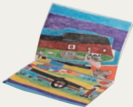
【銀賞】『スケッチブック』 竹内 保晴 / 2020