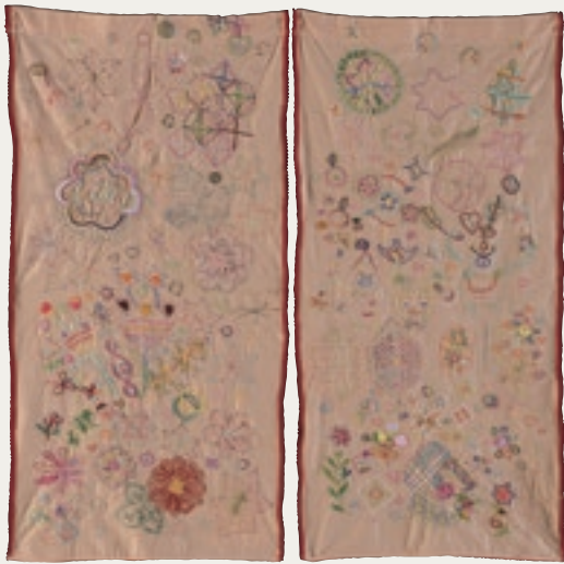
【金賞】『メルヘンのれん』 横田 佳代子 / 2020