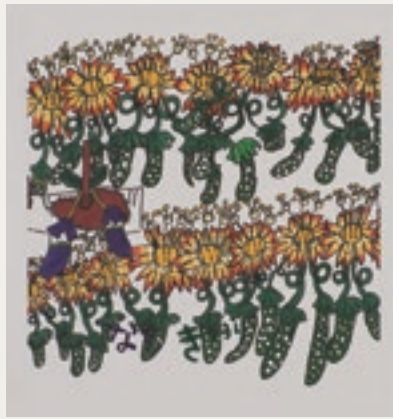
【銀賞】『なすときゅうり』 岩根 風優 / 2020